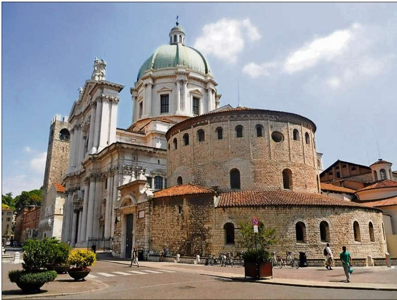
Il Dom da Brescia.

En la segunda mesad dal 16avel tschientaner tgrivan Bergam relaziuns intensivias cun las Trais Lias e cun la Confederaziun. Tras la Stamparia Landolfi a Poschiavo è entradas a Bergam ideas protestantas, adoptadas da plevons e scienziads. Aderents da la cretta refur-